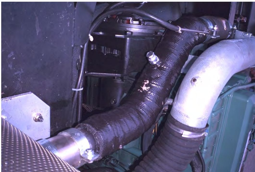
Isolierte Abgasleitung zwischen Trubolader und DPF mit Anschluß für Abgasgegendruckkontrolle