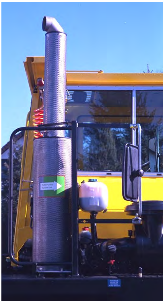
DPF-Ansicht mit Dosierbehälter (kl. Gefäß mit rotem Deckel)