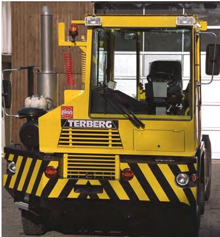
Ro-Truc mit aufgebautem GfA-Dieselpartikelfiltersystem