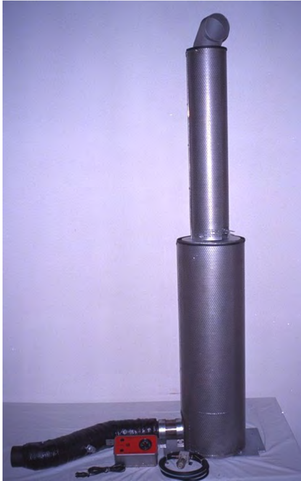
Aufbausatz GfA-Dieselpartikel- filtersystem für Ro-Truck