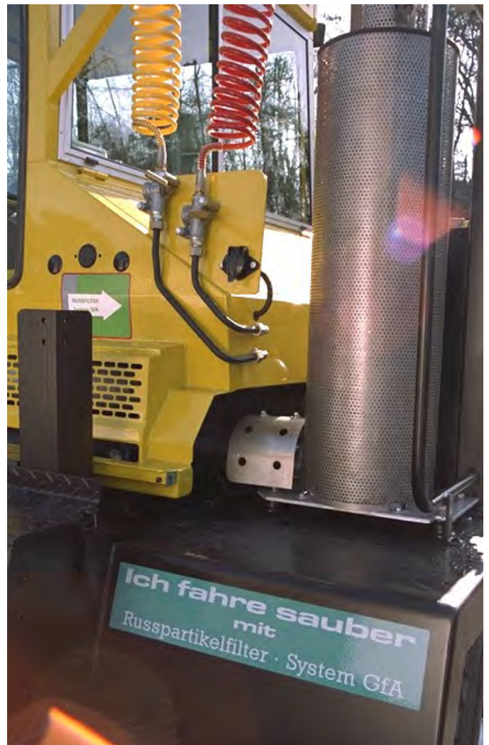
Handschutz über Anschluß zum Turbolader.