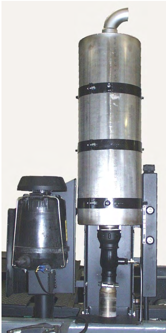
Ansicht des Filters mit Halterung ohne Hitzeschutz