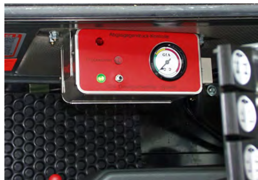
Plazierung der Abgasgedrückanzeige im Führerhaus (rechts neben Fahrersitz)