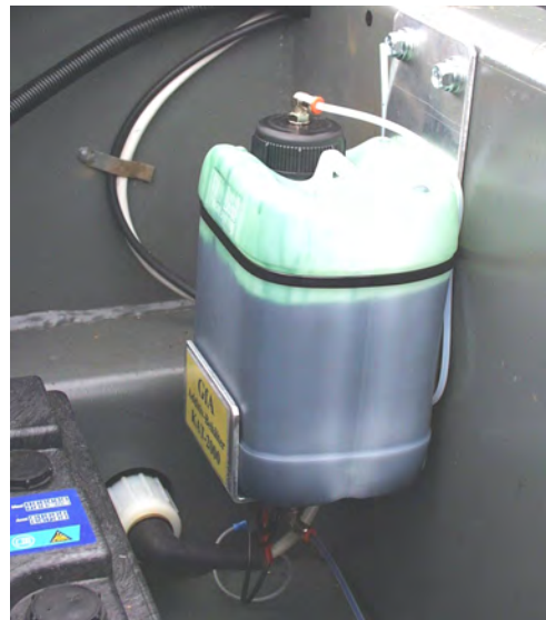
Plazierung des Dosierbehälters im Batteriekasten