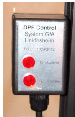
Bild unten: Drucküberwachung im Sichtfeld des Fahrers. Steuergerät montiert im Motorraum.