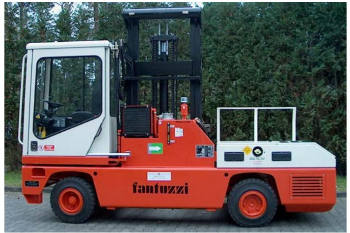
Bild oben: Gesamtansicht des Seitenstaplers mit eingebautem DPF-System.