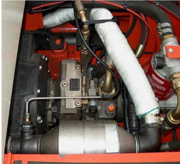
Bild links: Ansicht mit isoliertem Endrohr zum Original-Schalldämpfer.