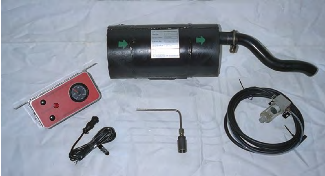
DPF-Einbausatz für Steinbock Boss CD 20 H