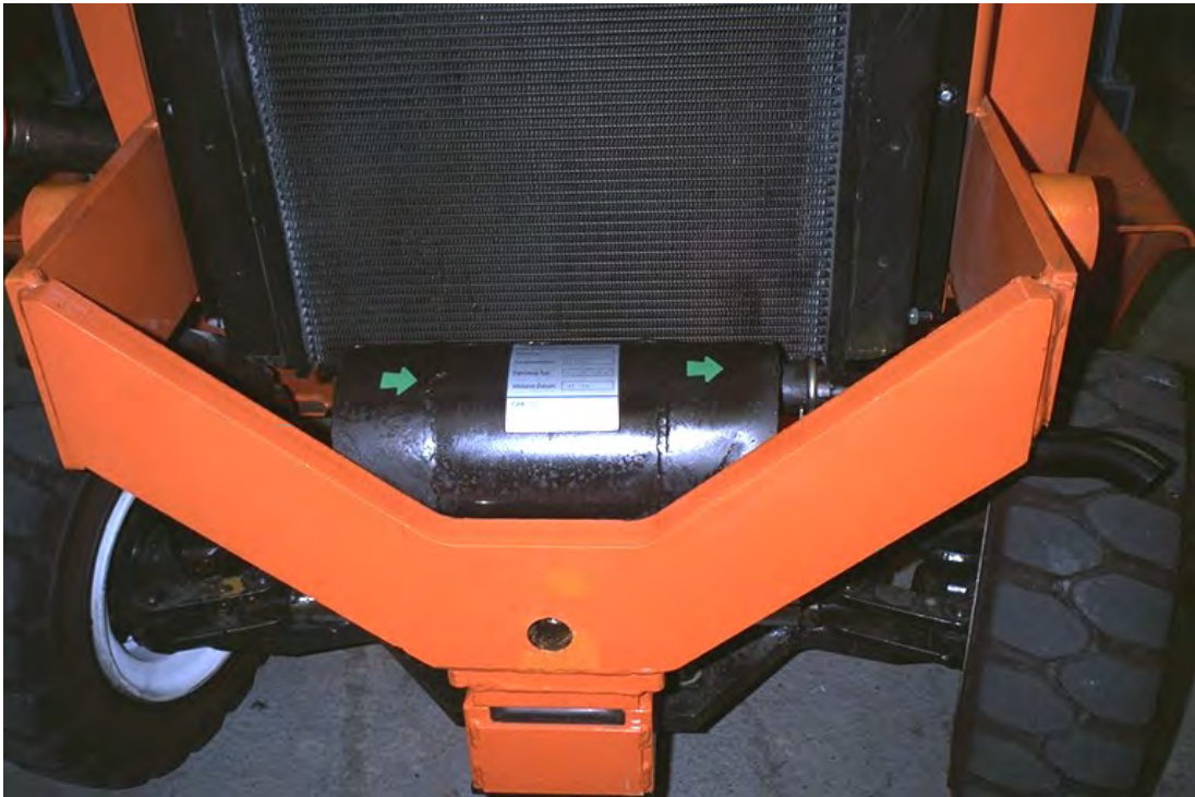
Dieselpartikelfilter im Originalschalldämpfer integriert